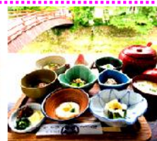
土門拳も訪れた、絶品の山菜料理